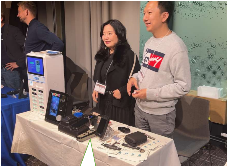
香港C4社 NDIRとのこと・・・