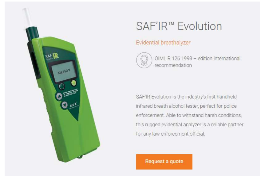
カナダ ACS社 NDIRハンディ (といっても、25センチくらい)